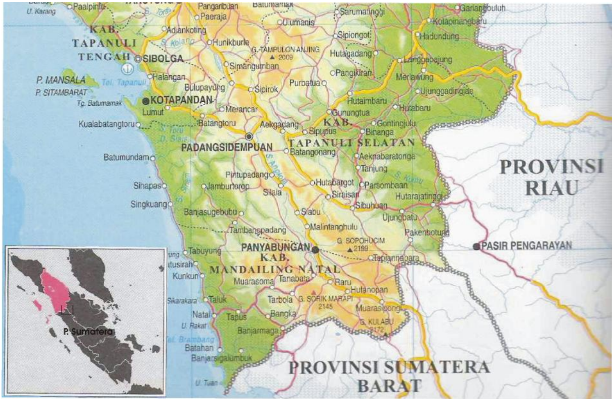
Gambar 1. Lokasi Daerah Panas Bumi Sampuraga, Madina, Sumatera Utara